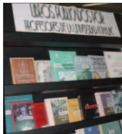
Universidad Anahuac图书馆展示该学校教师的出版物。