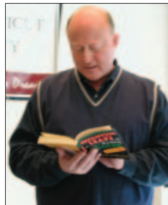
东康涅狄格州立大学 (ECSU) 化学教授在阅读他的新书“Quantum Leaps in the Wrong Direction: Where Real Science Ends...and Pseudoscience Begin”。